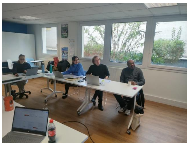
Comité de sélection de l'appel à projet « parents solos » 2022, le 14 octobre 2022, à Lille